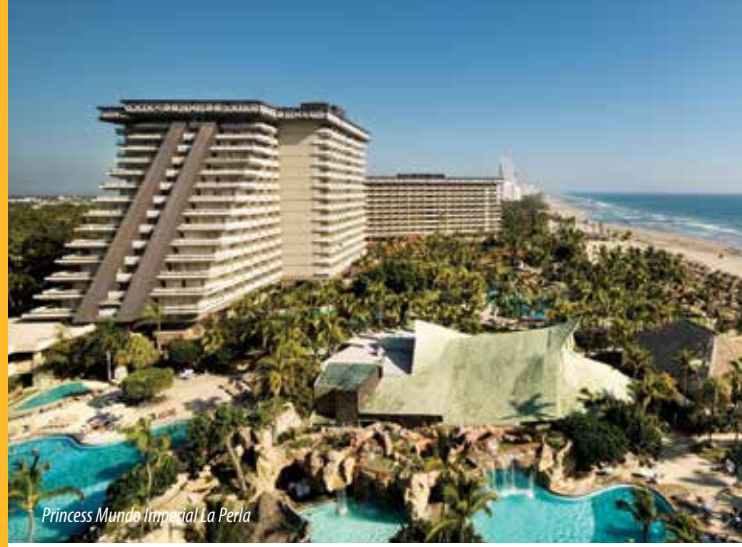
Princess Mundo Imperial La Perla