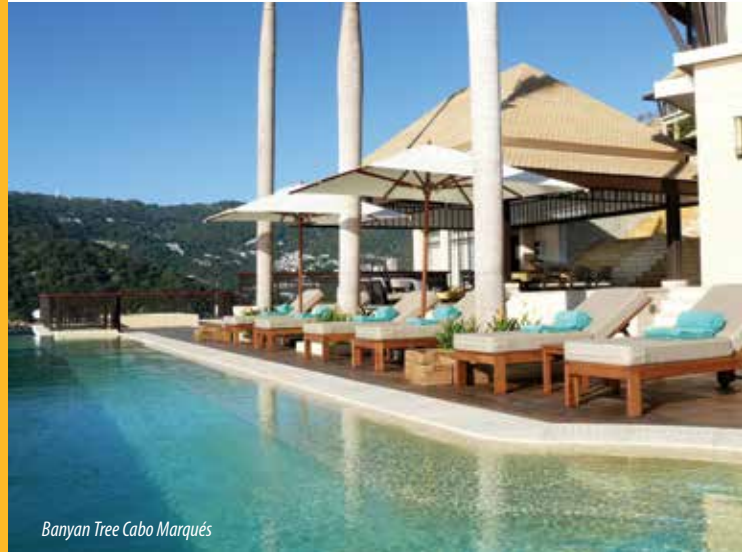
Banyan Tree Cabo Marqués