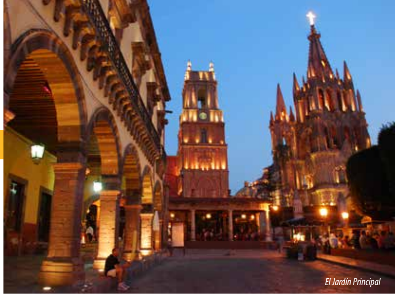
El Jardín Principal

El Jardín Principal es reconocido como el corazón de San Miguel con bellas bancas de hierro forjado y un cálido ambiente que lo marcan las armonías de los músicos que tocan en el kiosco central.