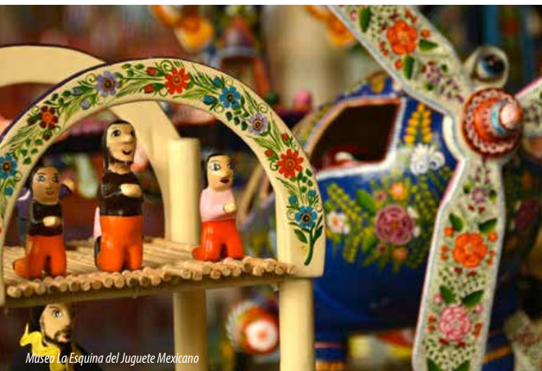
Museo La Esquina del Juguete Mexicano

Descubre San Miguel de Allende a través de cuatro conceptos: La Buena Vida, Cultura, Aventura y Reuniones. Las cuales se complementan unas con otras obteniendo que los participantes se involucren en un ambiente folklórico único en México. La belleza de su centro histórico con la arquitectura de sus edificios del siglo XVII y XVIII logran un ambiente de tranquilidad y armonía para ser recorrido caminando por sus estrechas calles empedradas, razón para ser nombrada como la mejor Ciudad del Mundo por la Revista Conde Nast Traveler en 2013.