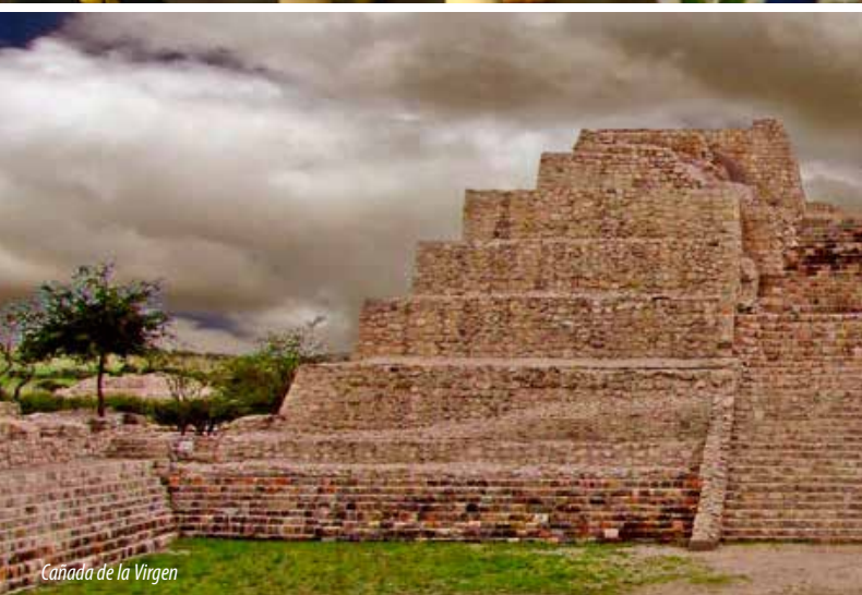
Cañada de la Virgen