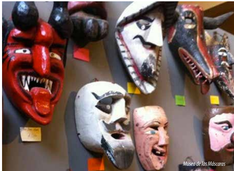
Museo de las Máscaras